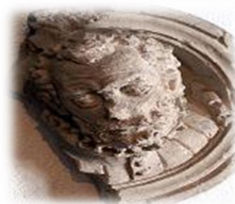
Busto de Fabio Nelli