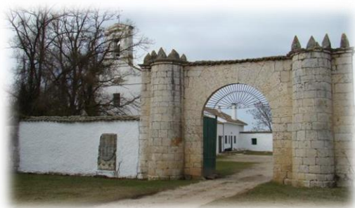
“Vega de Porras”.

Perteneciente en el siglo XIX a la Casa de Misericordia de Valladolid, la mitad del terreno estaba ocupada por viñedo y una casa con lagar que fue propiedad del Colegio de los Escoceses.